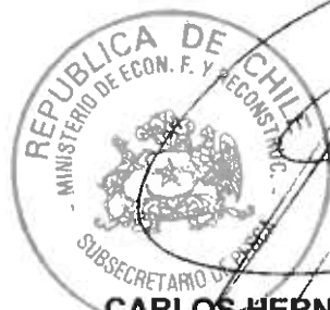
CARLOS HERNÁNDEZ SALAS Subsecretario de Pesca

La pesca se efectuará por el término de un mes, en las siete estaciones de muestreo indicadas en la resolución extractada y ubicadas en la Región Metropolitana, donde podrá capturar, con devolución, mediante equipos de pesca eléctrica y chinguillos, ejemplares de las especies principales nativas Bagre chico, Bagre, Puye, Cauque, Pocha, Tollo de agua dulce, Pejerrey, Trucha criolla, Trucha negra y Carmelita; e introducidas Trucha arcoiris y Trucha café.